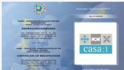
Die Markenurkunde

Unter der Nummer 011836293 ist die Wort-Bild-Marke „Casa:1“ des Erststädter Unternehmens Casa:1 Zementfliesen, Dichantz + Wiegand GbR in das Register für Gemeinschaftsmarken beim Harmonisierungsamt für den Binnenmarkt (HABM) eingetragen worden.