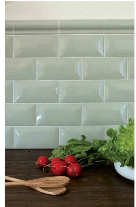
CANTONERA ANTIQUÉ #1,2x15

*SPECIAL PIECES ARE AVAILABLE IN ALL COLORS