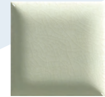
TACO ANTIQUE (#7,5x7,5)